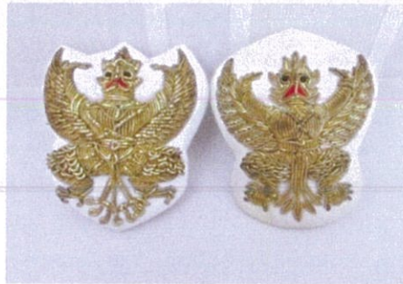
- เครื่องหมายหน้าหมวก