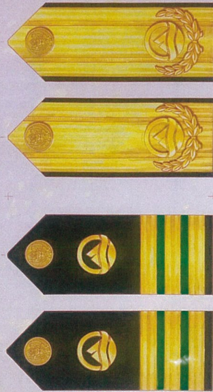
แบบอินทราณผู้บริหาร

แบบเครื่องหมายสำหรับเครื่องแบบปฏิบัติงาน สถาบันบริหารจัดการธนาคารที่ดิน (องค์การมหาชน)